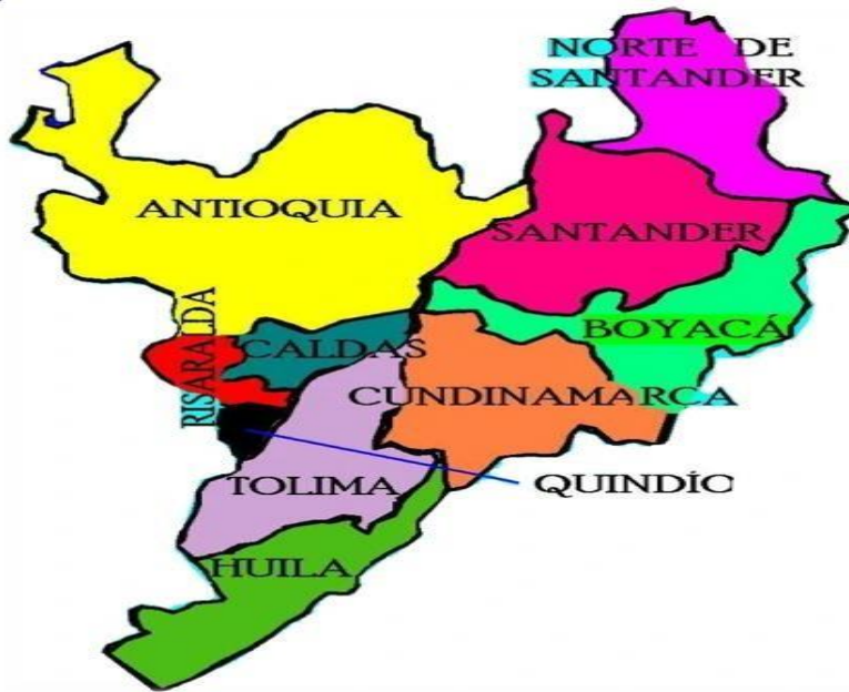
Ilustración 1 Mapa Región Andina

Actualmente dividido por varios departamentos: Bogotá. DC, Antioquía, Caldas, Cundinamarca, Huila, Norte de Santander, Quindío, Risaralda, Santander y Tolima. Está limitado al norte con la región Caribe, al noroeste con Venezuela, al este con la Orinoquía, al sureste con la Amazonia, al sur con Ecuador y al oeste con la región del Pacífico. Por otro lado, las cordilleras dan lugar a numerosos valles, cañones, mesetas y un sistema fluvial cuyos principales ríos son el Cauca y el Magdalena. La región Andina es la zona más poblada y económicamente activa en el país.