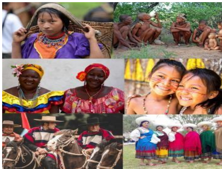
Ilustración 2 Comunidades Indígenas