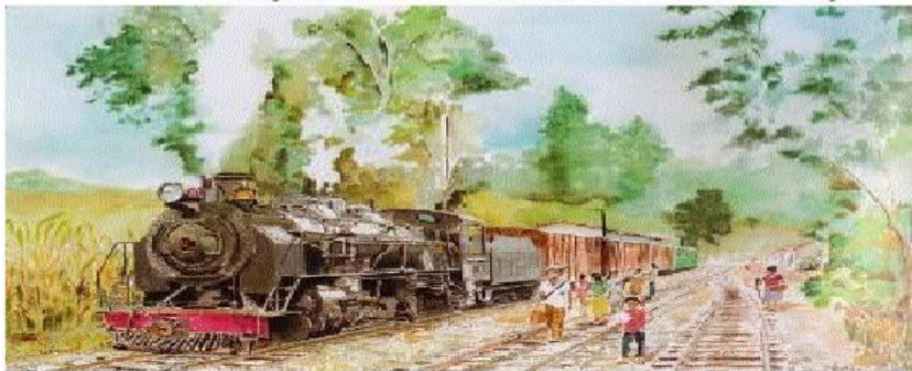
Ferrocarril de Antioquia - Gustavo de Greiff