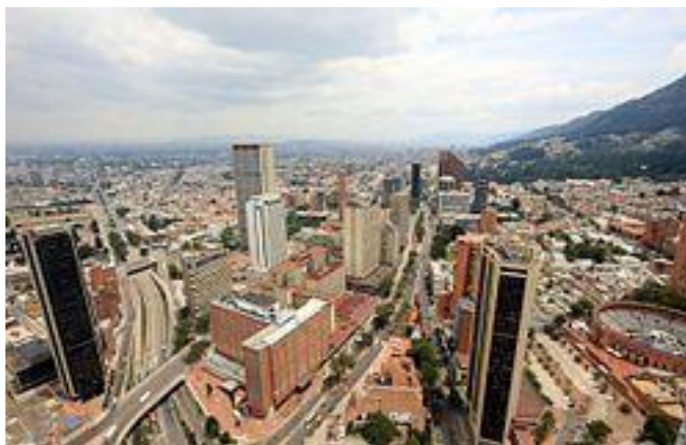
Ilustración 3 Capital Colombiana